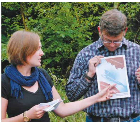
Bei Hunsrücker Sommerwetter, Stubbi und Wildschweinsteak lassen sich Ideen besonders gut austauschen.